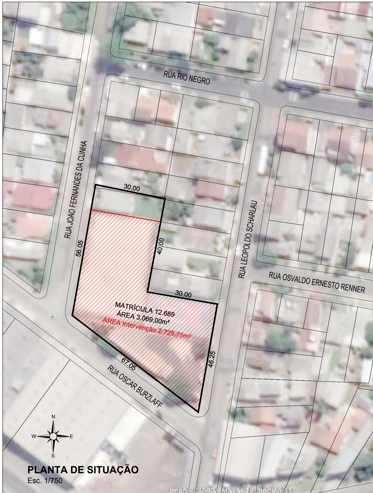
PLANTA DE SITUAÇÃO Esc. 1/750