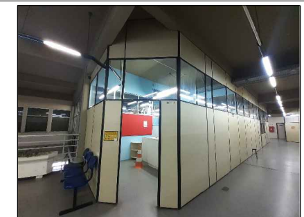
Padrão Divisórias existente