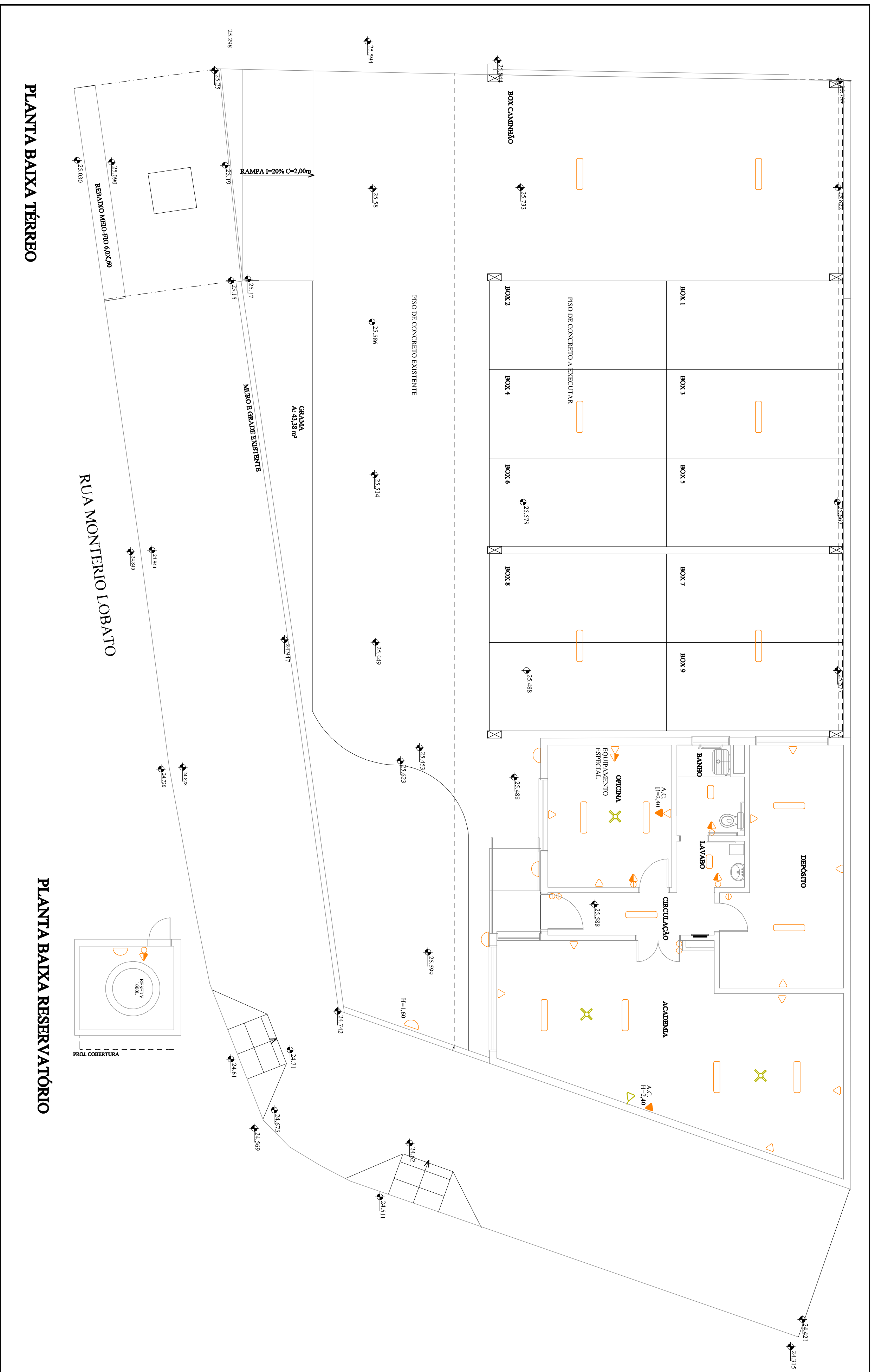
PLANTA BAIXA TÉRREO