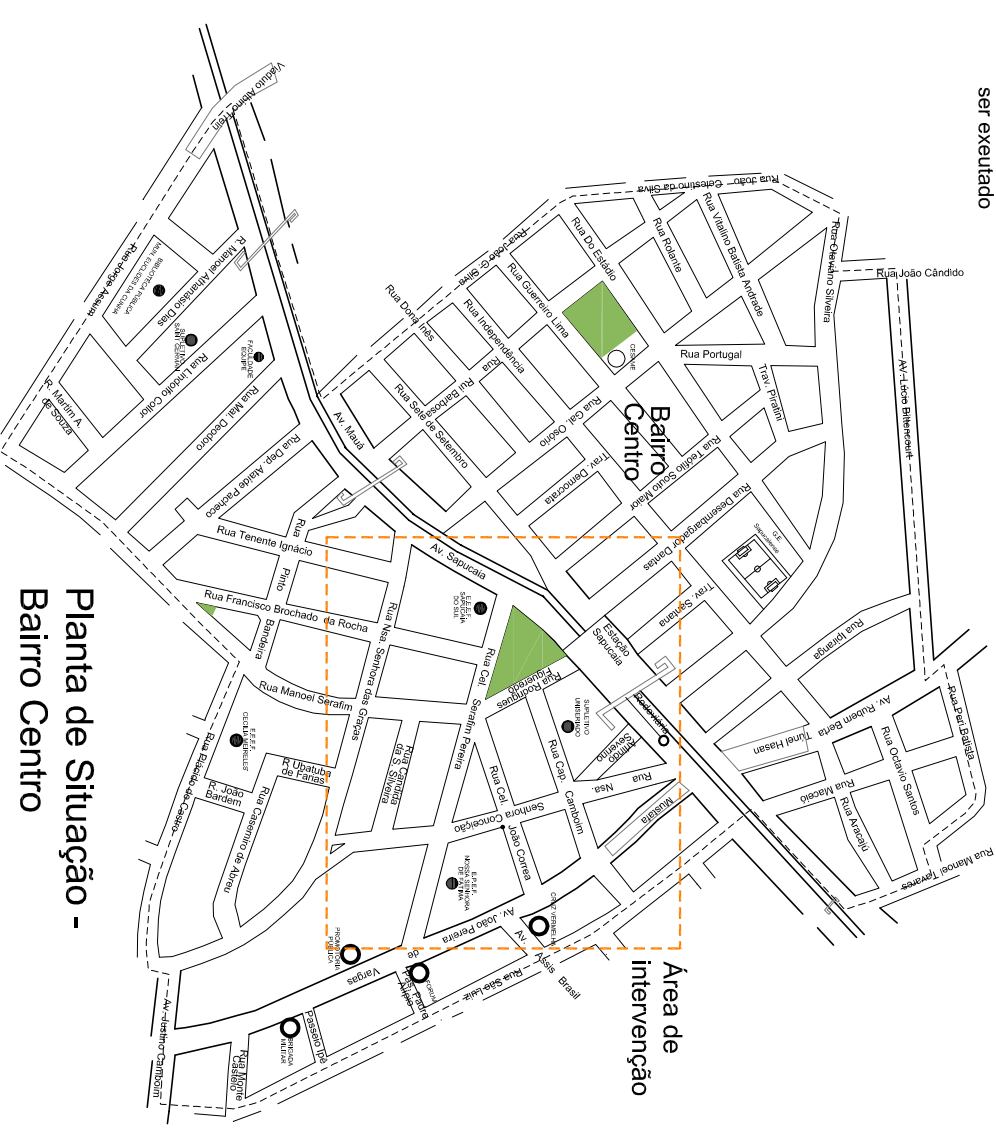
Planta de Situação - Baixo Centro