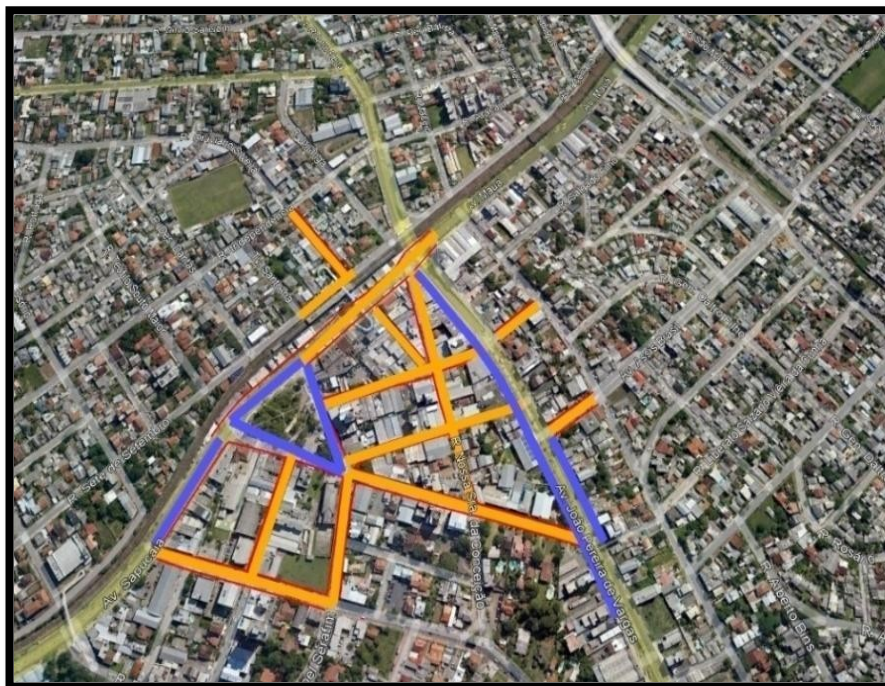
Figura 2- Área Central delimitada com Ruas / Avenidas na cores laranja e azul

ESTE DOCUMENTO FOI ASSINADO EM: 29/01/2024 14:51 -03:00-03 PARA CONFERENCIA DO SEU CONTEUDO ACESSSE https://c.atende.net/p65b7e5a1384b4 .