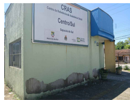
FOTO 03 REBOCO E PINTURA DAS PAREDES EXTERNAS