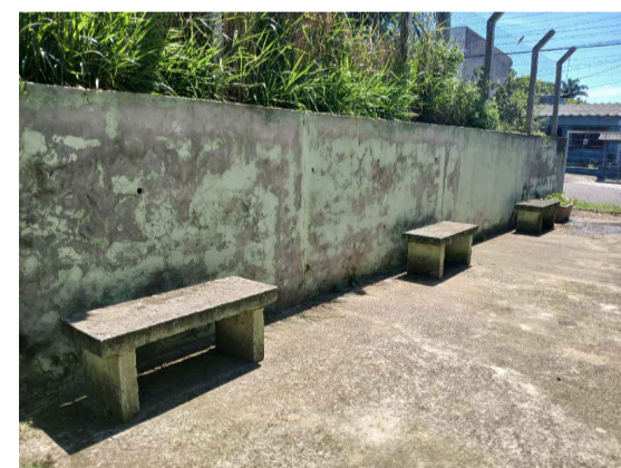
FOTO 04 MURO EXISTENTE