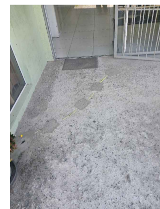
FOTO 05 REFAZER PISO EM CONCRETO - ENTRADA