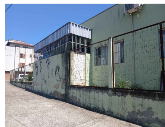
FOTO 01 REBOCO E PINTURA DA MURETA E PAREDES EXTERNAS